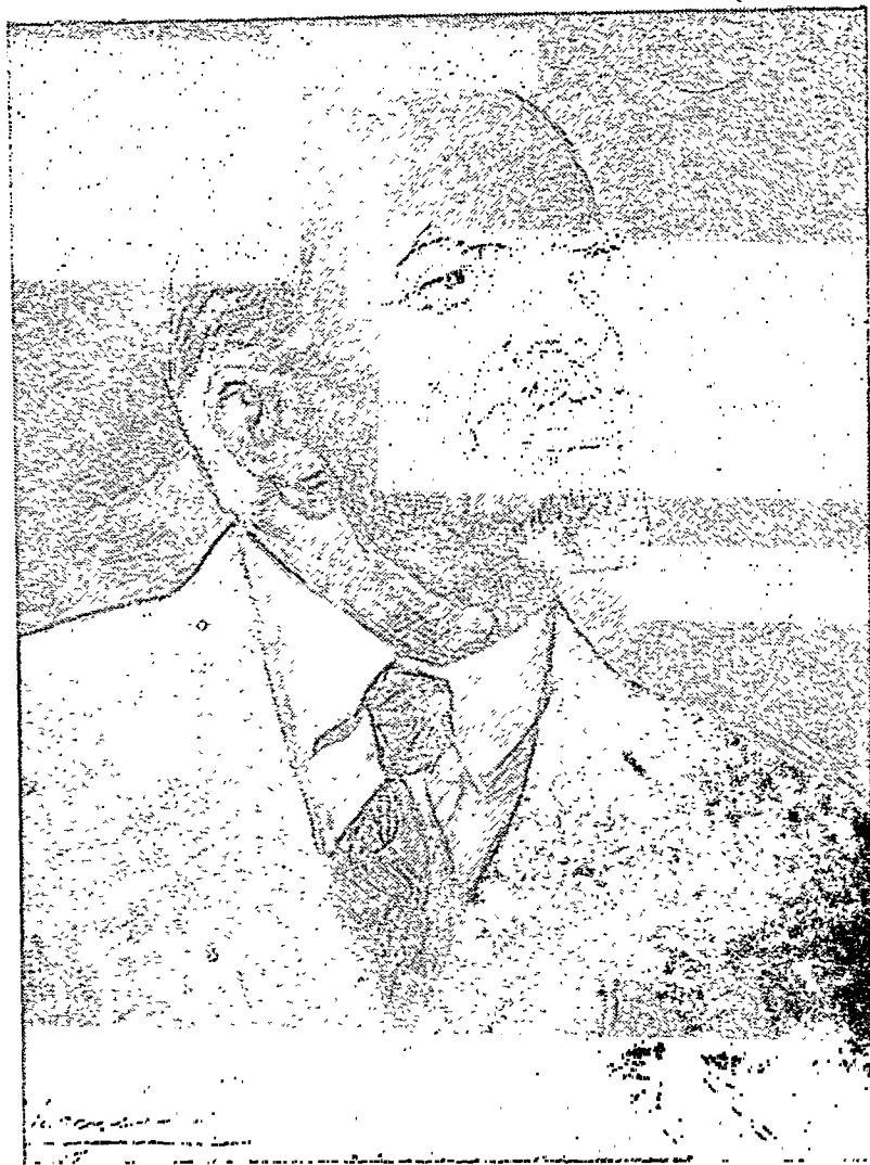
बोल्शेविक क्रान्ति के जन्म-दाता कामरेड वी० आई० लेनिन ( १८७० — १९२४ )